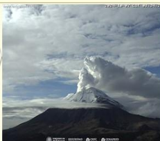
Imagen destacada de las últimas 24 horas